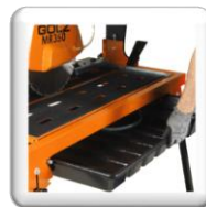
Bac à eau amovible pour entretien facile