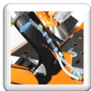
Coupe biseau 45°