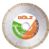
SLF10 Gamme Technique

Nous recommandons l'utilisation de nos disques diamantés pour votre GS350.