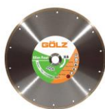
SLF20 Gamme Prémium