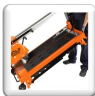
Roues de transport