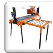
Table latérale à rouleaux (accessoire)