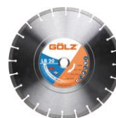
LB20 Universel Basic