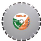
SG35 Granit Turbo Prémium