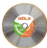
SlimFast Gamme Excellence