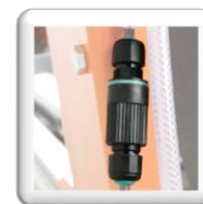
Pompe à eau électrique avec connectique rapide