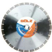
Whisper RX1 Gamme Excellence