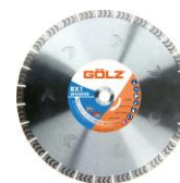
RX1 Gamme Excellence