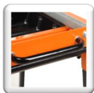
Poignée de transport