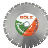
GN30 Granit Prémium - brasé