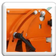
Profondeur de coupe réglable