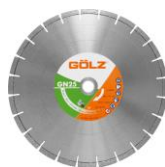
GN25 Granit Standard