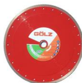
SF30 Gamme Excellence