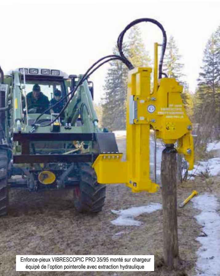
Enfonce-pieux VIBRESCOPIQ PRO 35/95 monté sur chargeur équipé de l'option pointerolle avec extraction hydraulique

PAR PERCUSSIONS SUR MINI-PELLE, CHARGEUR ET TÉLESCOPIQUE