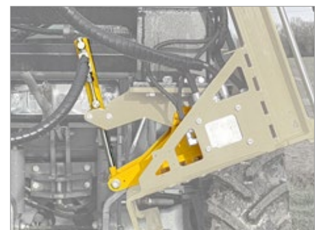
Vérin d'inclinaison pour attache Télescopique/Chargeur frontal (+/- 20°)