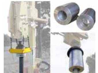
Support martyr permanent Martyr à définir selon vos pieux