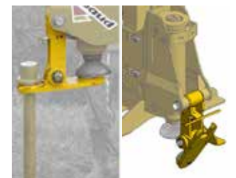
Pointerolle avec extraction hydraulique