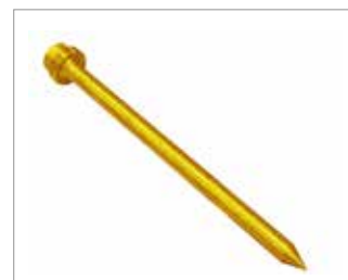
Pointerolle seule - longueur 1,30 m