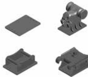
Attache rapide pour mini-pelles de toutes marques