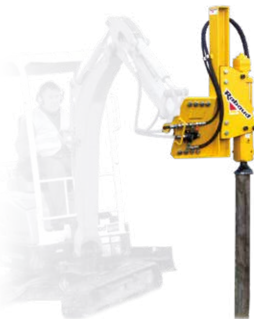
VIBRESCOPIC 15/35 sur mini-pelle