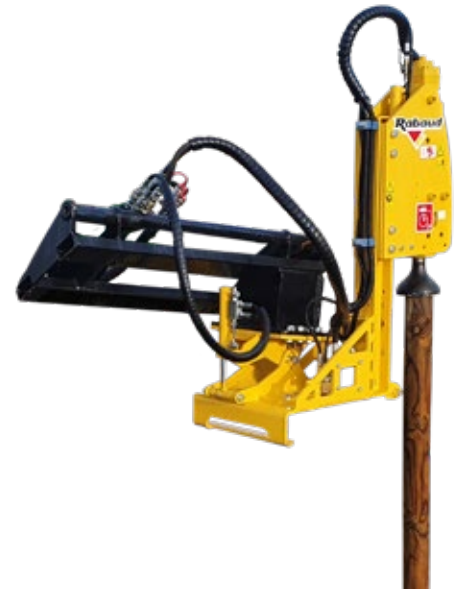
VIBRESCOPIC PRO 17/35