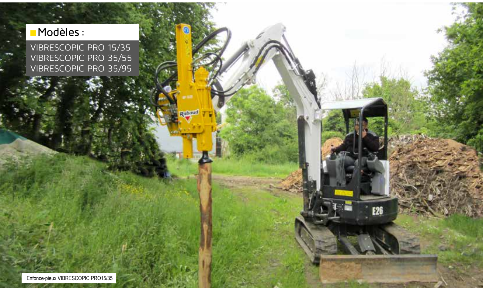
Enfonce-pieux VIBRESCOPIC PRO15/35

VIBRESCOPIC PRO 15/35 VIBRESCOPIC PRO 35/55 VIBRESCOPIC PRO 35/95