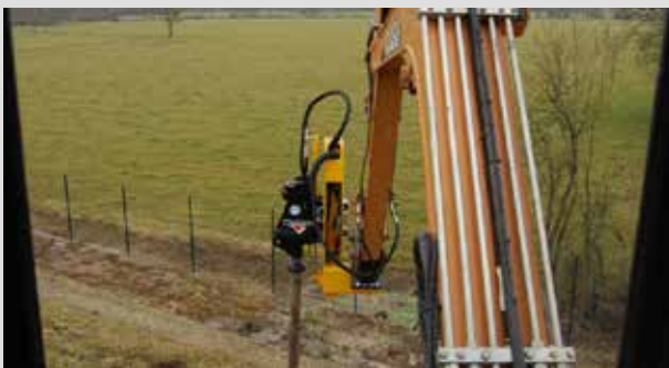
Enfonce-pieux déporté pour une meilleure visibilité en cabine