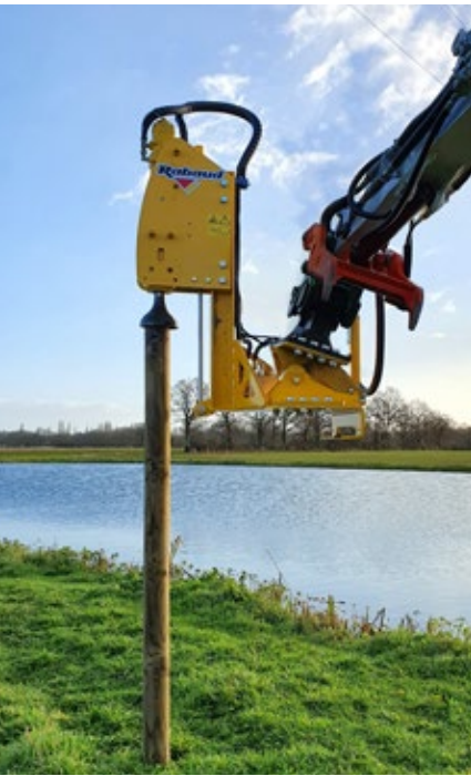
VIBRESCOPIC PRO 17/35 sur mini-pelle et avec option inclinaison

AVEC OPTION INCLINAISON, POUR MINI-PELLE ET TÉLESCOPIQUE