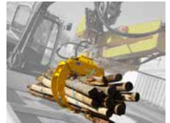
Grappin de manutention (nécessite 2 lignes DE ou vanne 6 voies)