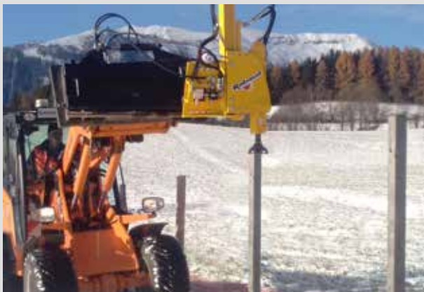
Enfonce-pieux VIBRESCOPIQ 15/35 monté sur chargeur