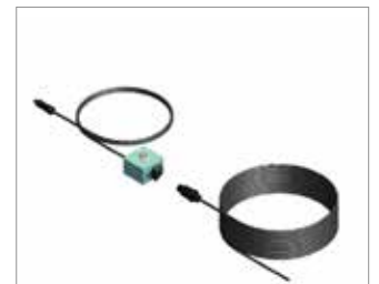
Vanne 6 voies + boîtier de commande en cabine + enrouleur électrique avec câble 15 ou 12 m