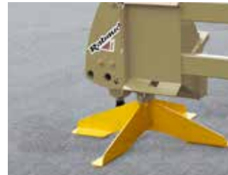
Support de remisage (de série sur le 35/95)