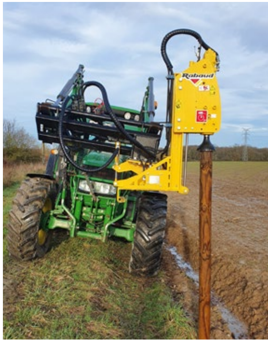
VIBRESCOPIC PRO 17/35 sur chargeur, avec option inclinaison