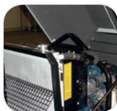
Crochet de levage sur châssis et non plus sur le moteur