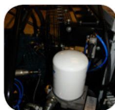
Filtration séparée groupe vis/moteur