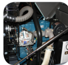
Décrochage du capot facilité avec système d'ouverture facile par pistons